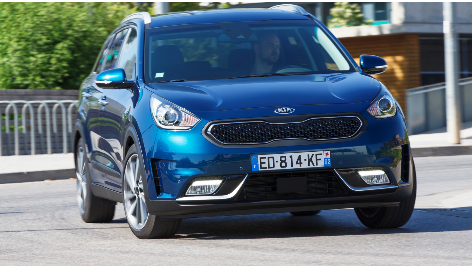
KIA Niro hybrid